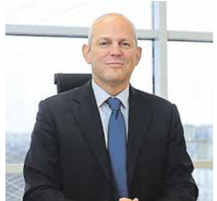
Pr. Jérôme SALOMON Directeur général de la santé

Le présent guide permettra de mieux formaliser la pratique du retour d'expérience. Il conviendra de faire preuve de flexibilité en adaptant les outils et la méthodologie mis à disposition, en prenant également en compte la diversité des situations rencontrées et les ressources nécessaires à sa mise en œuvre.